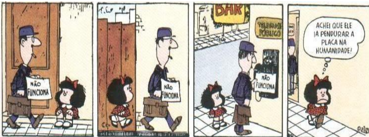
(QUINO, Mafalda 7. São Paulo: Martins Fontes, 1993.)

5. Leia tirinha que se segue atentando-se para as relações morfossintáticas das frases.