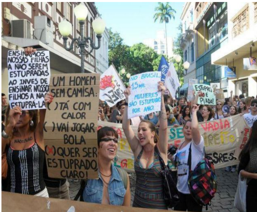
Cartazes na Marcha das Vadias de 2012